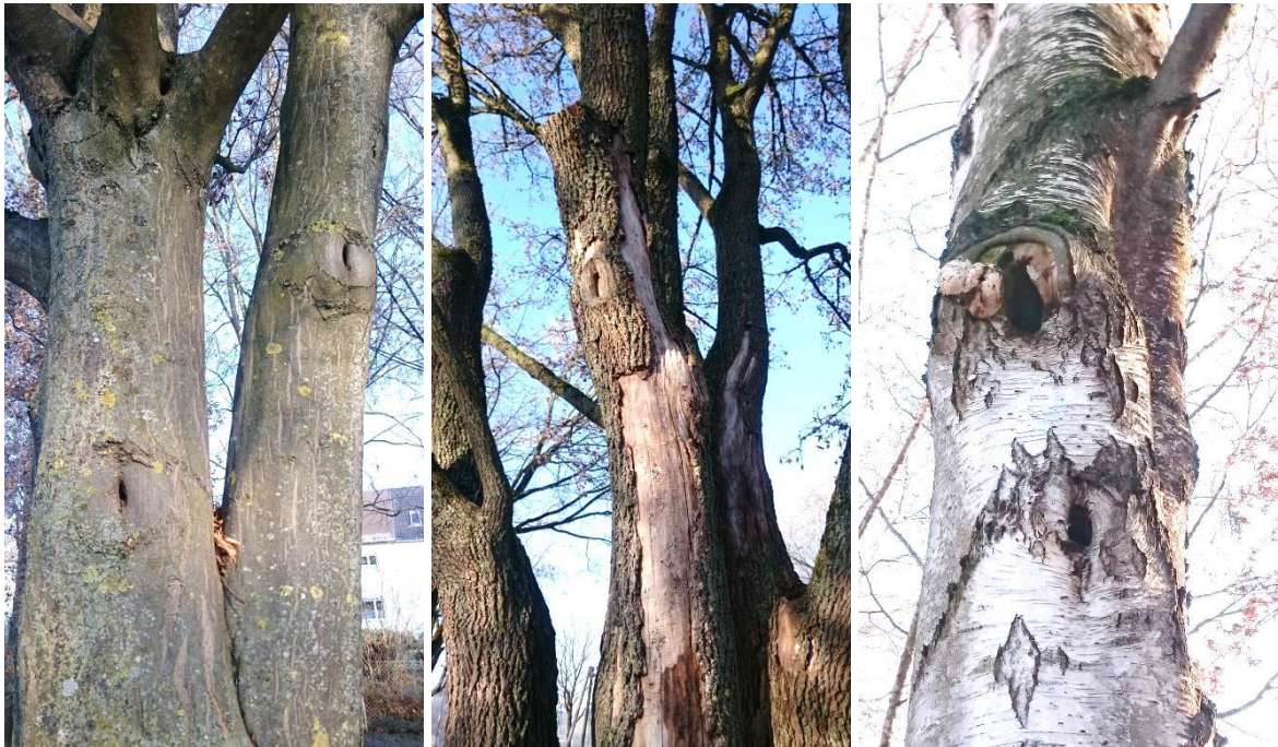
Abb. 2 links: kleinere Asthöhlungen an Hain-Buche, Mitte: Rindenabplattungen, rechts: größere Höhle an Birke

Totholzstrukturen (liegendes oder stehendes Totholz) konnten innerhalb des Geltungsbereiches nicht ermittelt werden. Folgende Abbildungen geben exemplarisch die vorgefundenen Strukturelemente wider.