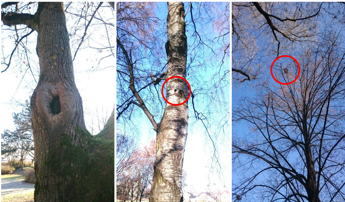
Abb. 3 links: größere Höhle an Ahorn, Mitte: Spechthöhle an Birke, rechts: Nest in Linden-Krone