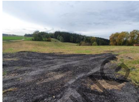
Blick vom Flurweg nach Süd-Westen

Die Auswirkungen des Eingriffs auf das Schutzgut Landschaftsbild sind unter Berücksichtigung der Ausgangssituation und der Vermeidungsmaßnahmen von geringer Bedeutung .