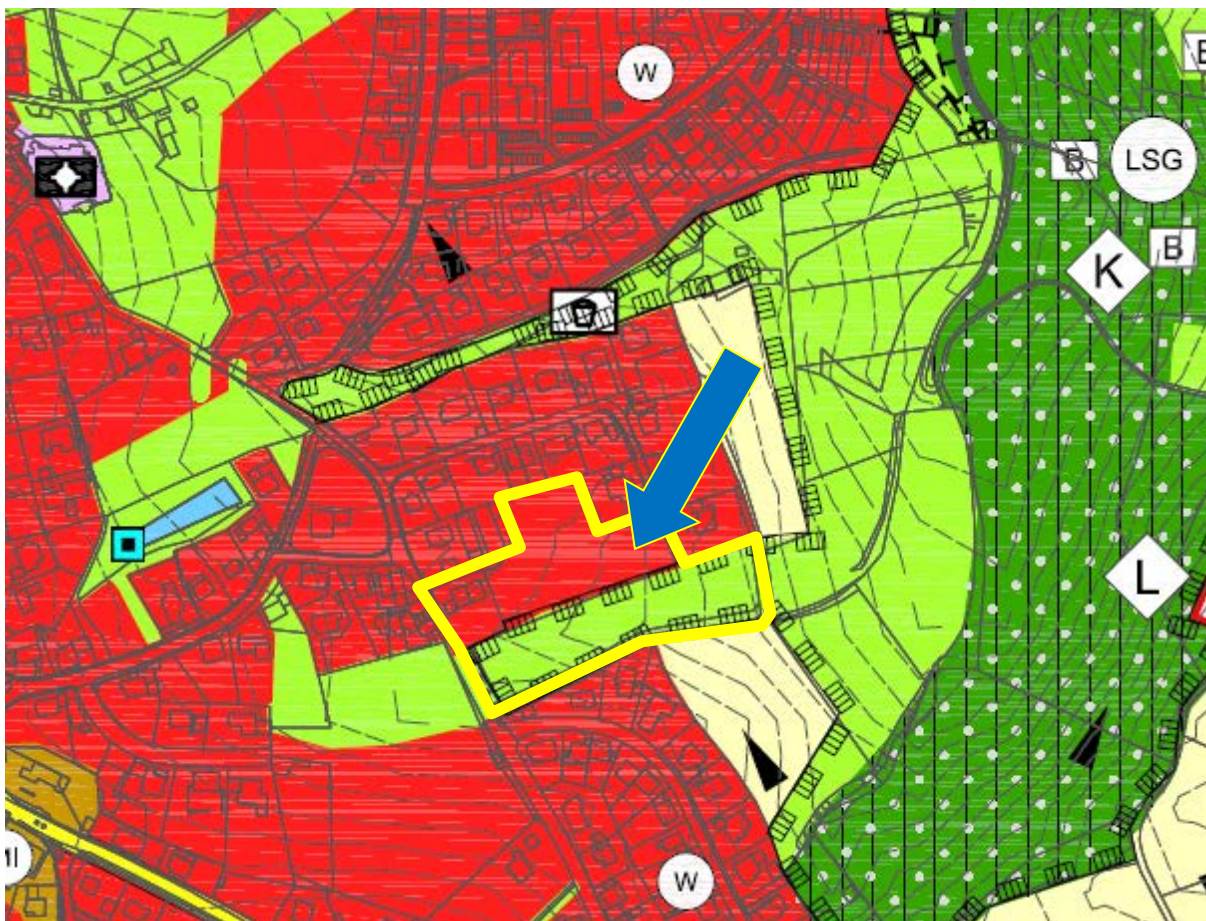
Ausschnitt aus dem rechtswirksamen Flächennutzungsplan Landshut, vergrößert auf Maßstab 1:2.500, Planungsgebiet markiert