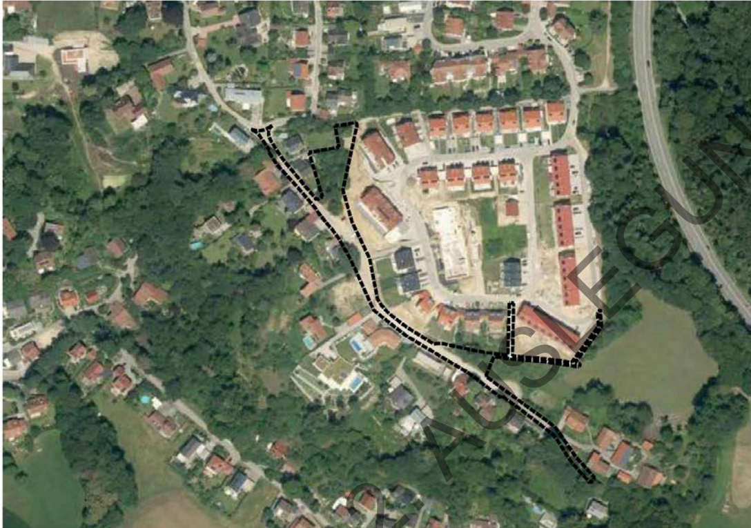
Luftbild der Bayerischen Vermessungsverwaltung mit Darstellung Geltungsbereich

Das Planungsgebiet liegt im Bereich Moniberg Süd im Stadtteil Peter und Paul und umfasst ca. 4.920 m 2 .